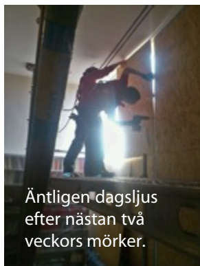
Äntligen dagsljus efter nästan två veckors mörker.

7/5 Varde ljus! Förhoppningsvis får vi lite ljusare idag i stora rummet. Killarna är f ö mycket diskreta och vänliga. Kanske innerfönster i kväll, får se.