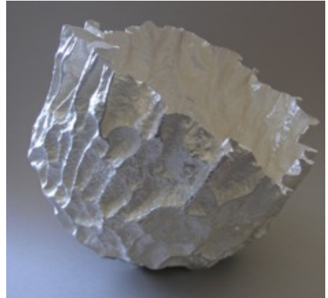
Skål i tunn finsilverplåt. Vecken ger stabilitet.

–Att jag träffar människor, det sociala sammanhanget. Att inte bara sitta ensam hemma hela tiden. Och på galleriet – Platina