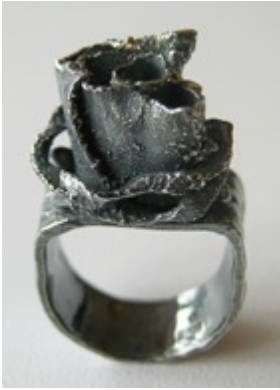
Ring i oxiderat silver, ros krönt med en liten diaman.

Och köpte ett halssmycke, ganska grovt, för att fira att hon fått en artikel publicerad i en vetenskaplig tidskrift.